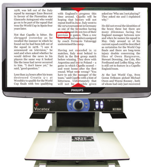
Abbildung: Vocatex Basic mit 23" Monitor

... wenn die Augen müde und die Texte länger werden